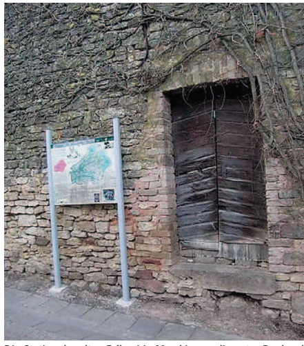
Die Station der alten Fellerei in Merchingen, die unter Denkmalschutz steht.

Nun wendet sich der Weg zurück zur heutigen Pfarrkirche St. Agatha. Dieses außergewöhnliche Bauwerk des Expressionismus wurde von dem bekannten österreichischen Architekten Clemens Holzmeister im Auftrag des Pfarrers Johann Speicher errichtet. Die Tafel vermittelt neben vielen